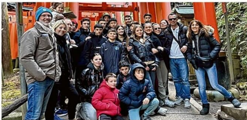
Les judokas d'Ensues-la-Redonne lors de la visite du sanctuaire de Fushimi Inari avec ses 10 000 Toris.

"Après un voyage en 2023 au Sénégal, c'est au Japon que nous avons décidé de poser nos valises, même si c'était un pari fou. Plus de 18 mois de préparation