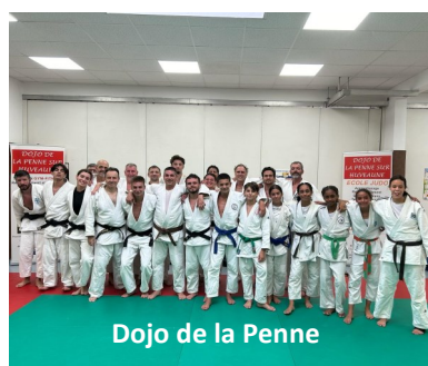
Dojo de la Penne